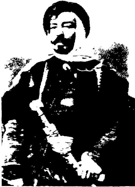
لوي في ملابس سورية أو جزائرية